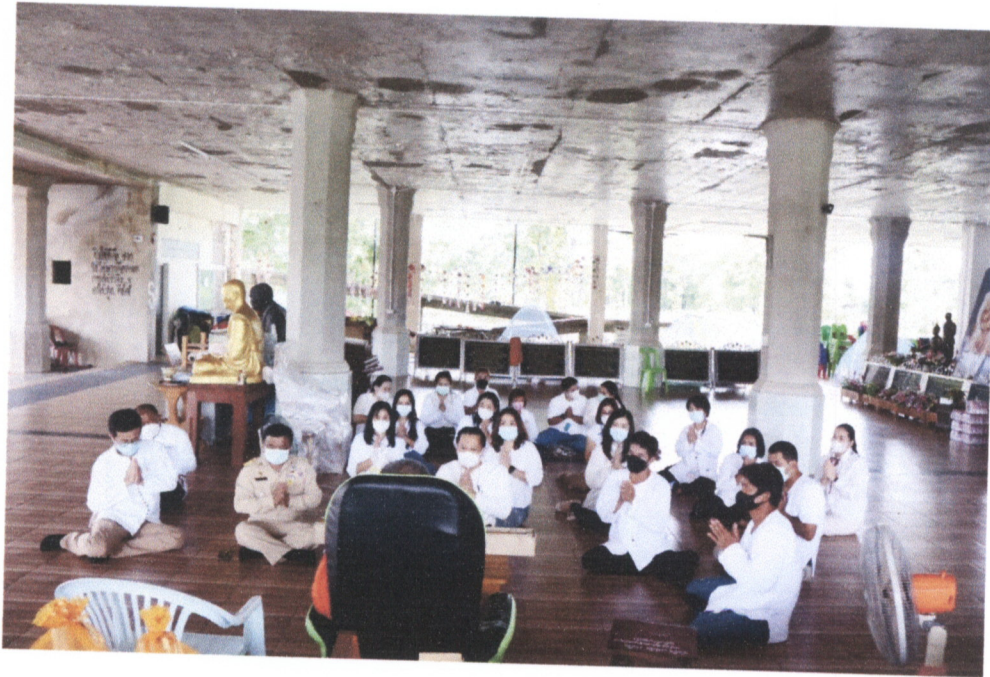
ภาพถ่ายกิจกรรม พิธีกรรมต้อนรับปีใหม่ ๒๕๖๗ เมื่อวันที่ ๕ เดือน มกราคม พ.ศ. ๒๕๖๗ ณ วัดอนัมมิตังค์ อำเภอห้วยแก้ว จังหวัดพะเยา